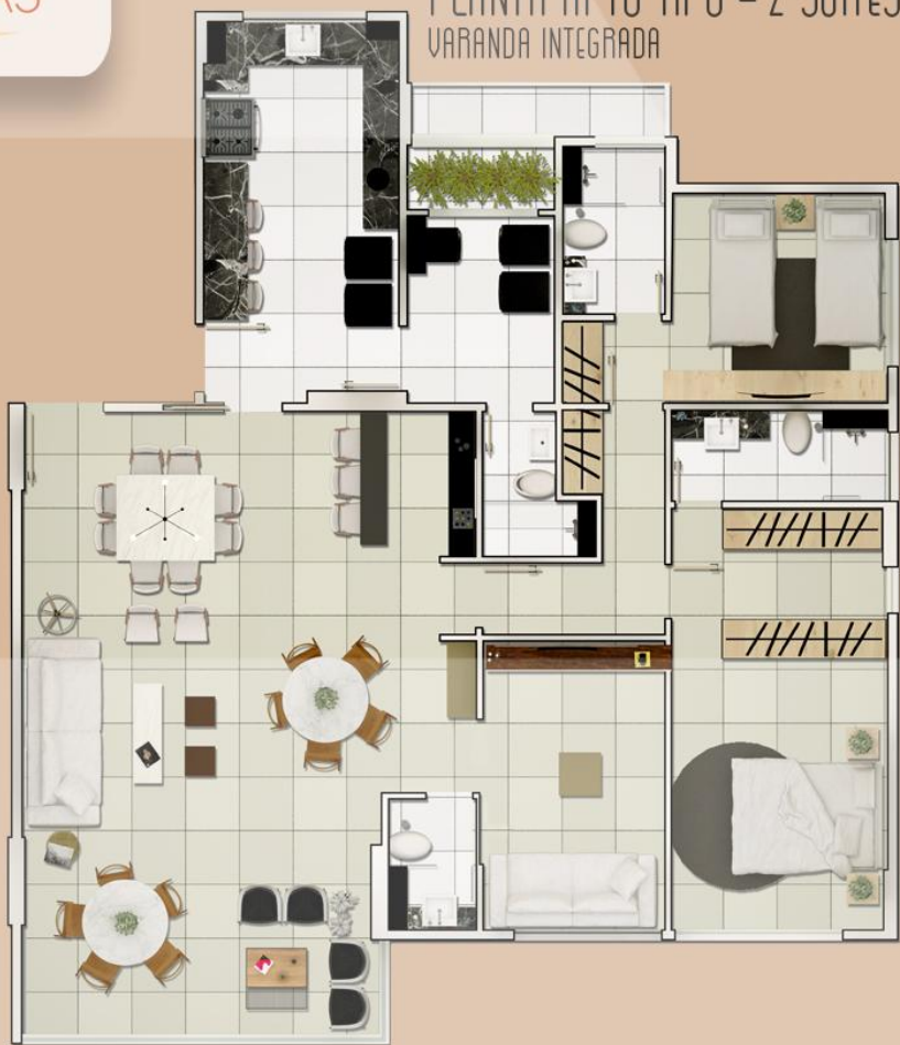
PLANTA APTO TIPO - 2 SÚITES VARANDA INTEGRADA