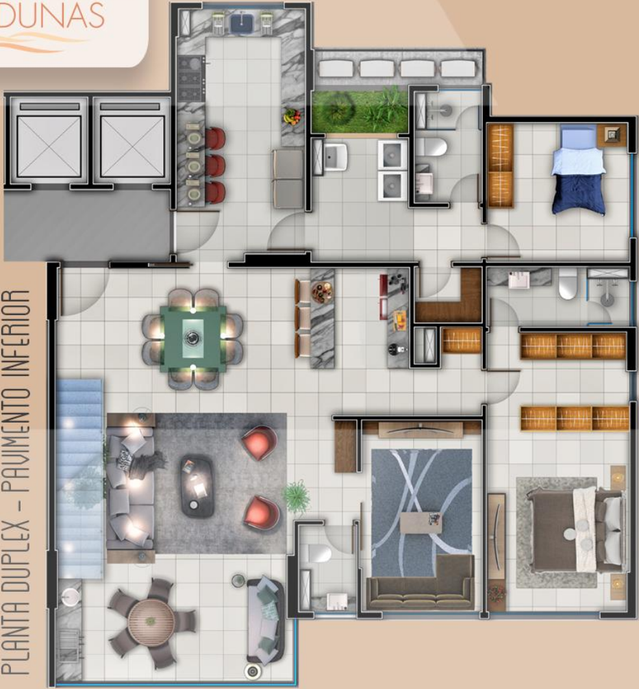
PLANTA DUPLEX – PAVIMENTO INFERIOR